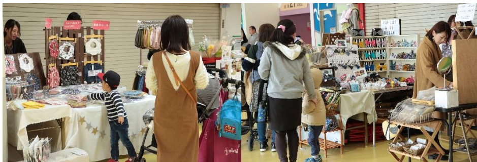
※ママ100ブース過去の実施風景