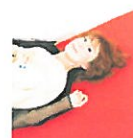
My Little Lover

また、16日にはテレビ愛知の情報番組「日曜なもんで！」を公開生放送！番組MCの杉浦太陽も来場します。